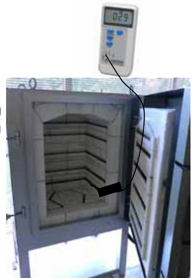
工業炉内の温度管理